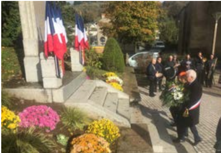
Cérémonie de commémoration du 11 novembre