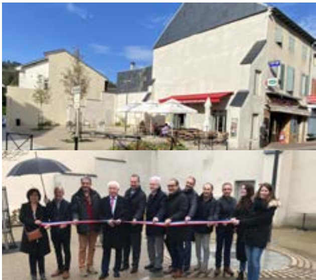
Place Rue de la République