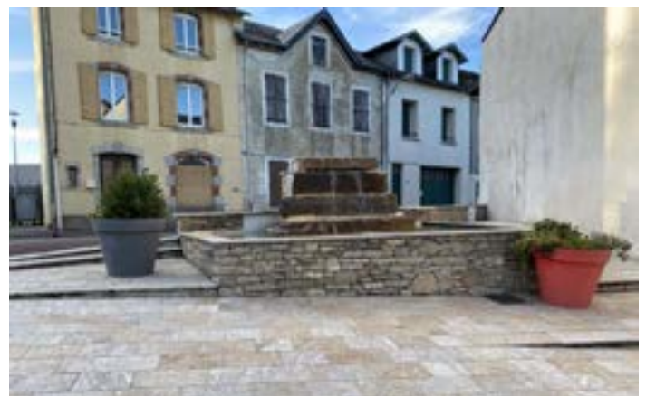
Fontaine rue Edouard Barbey