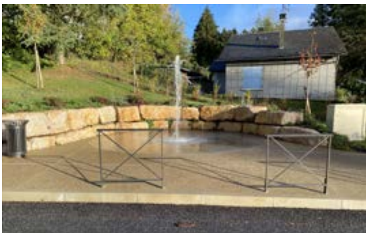
Fontaine Moulin Paradou