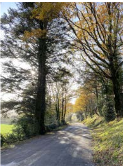
Travaux d'embranchement sur la route les Vidals - Latrivalle

La salle des Vidals a reçu une très bonne isolation intérieure permettant une meilleure acoustique et un meilleur confort thermique. La peinture sur l'isolation se fera dès que possible.