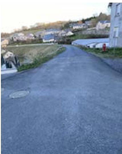
Travaux rue J P Alengrin