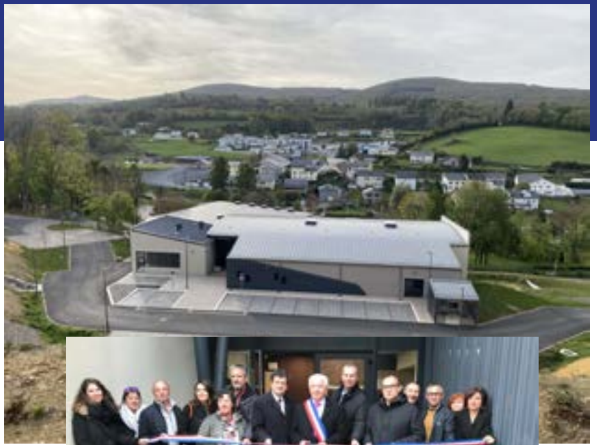
Salle Saint Michel