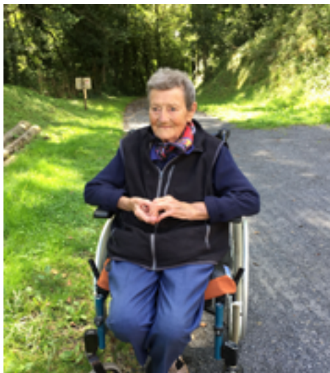
Sur le sentier du petit train