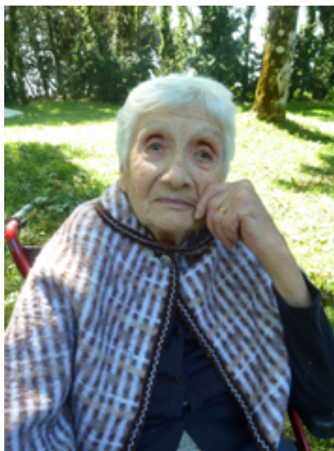
A Saint Jean del Frech