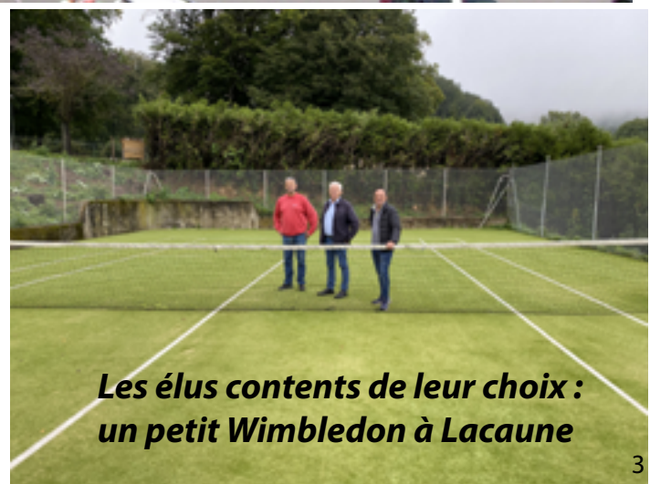
Les élus contents de leur choix : un petit Wimbledon à Lacaune