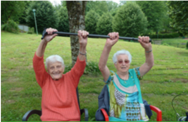
Gym en plein air au bord du lac d'Espérouse.