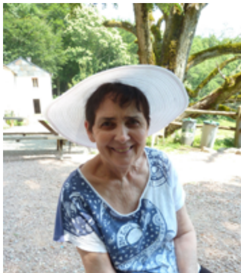
Sous le tilleul à Payrac