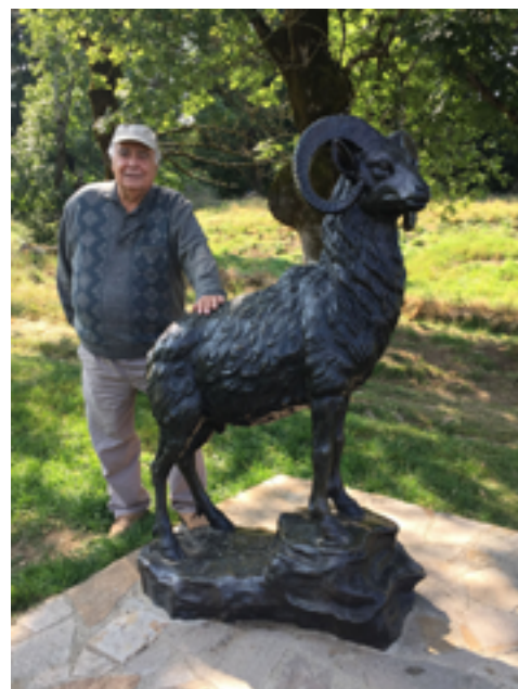
Dans les Monts de l'Espinouse : deux beaux spécimens !!!