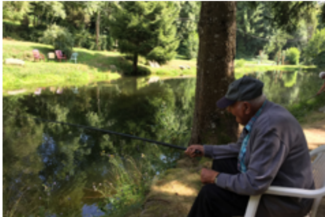
Pêche pas miraculeuse !!!