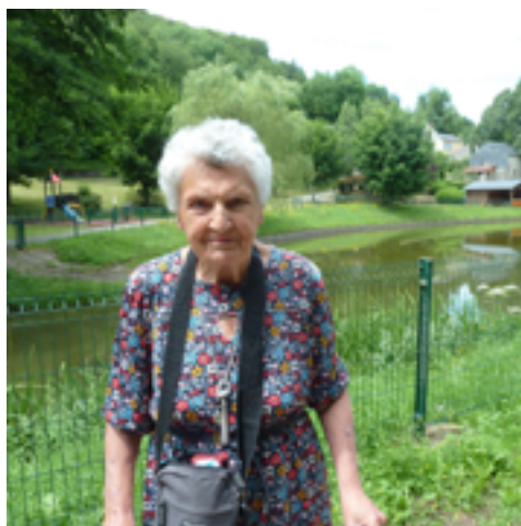
Randonnée au bord du lac d'Espérouses