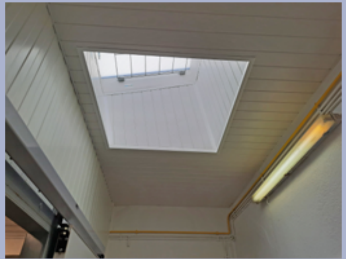
Travaux à la cantine scolaire

A noter aussi le démarrage des travaux de changement des réseaux AEP eaux usées et pluvial, rue du Temple et rue Maresquier, et de la rue du Biarnès jusqu'au pont de la rue de Peyruc.