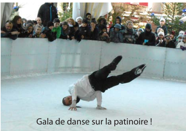
Gala de danse sur la patinoire !