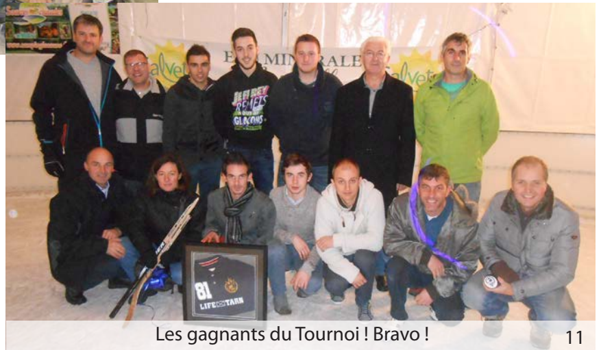
Les gagnants du Tournoi ! Bravo !