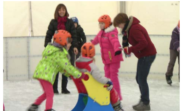
Ecoles et collège ont profité de la patinoire !

Les quatre équipes finalistes du Tournoi Associations/Entreprises