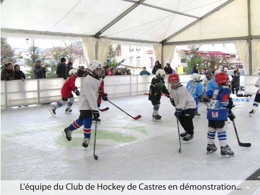
L'équipe du Club de Hockey de Castres en démonstration...