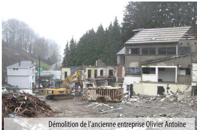
Démolition de l'ancienne entreprise Olivier Antoine

Mercredi 3 mars, mercredi 3 juin, mercredi 2 septembre et mercredi 2 décembre.