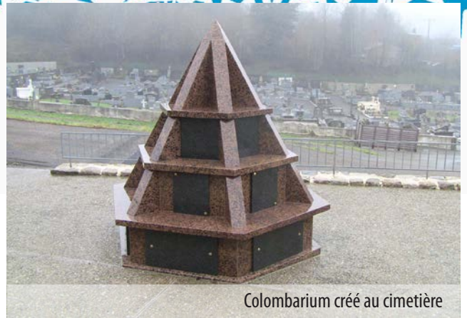
Colombarium créé au cimetière

Cimetière : des poignées ont été posées au dépositaire et un deuxième colombarium a été créé.