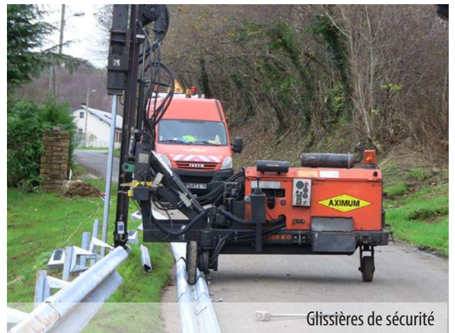
Glissières de sécurité

Grâce aux mesures énergétiques gouvernementales, les combles de la maison de retraite ainsi que les réseaux de la maison de retraite, des écoles et de la crèche seront isolés gratuitement. Toujours dans le cadre des mesures gouvernementales, les combles des écoles seront également isolés pour un coût équivalent à 1/3 du prix réel.