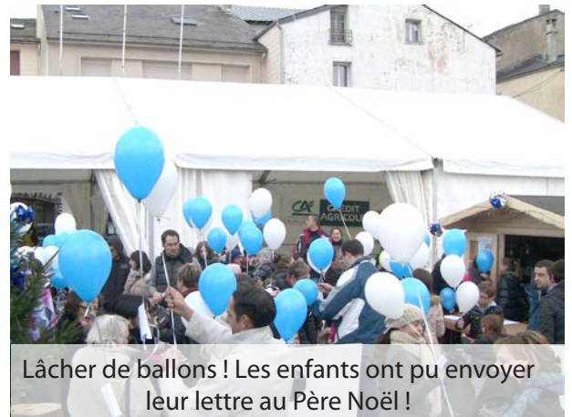
Lâcher de ballons ! Les enfants ont pu envoyer leur lettre au Père Noël !