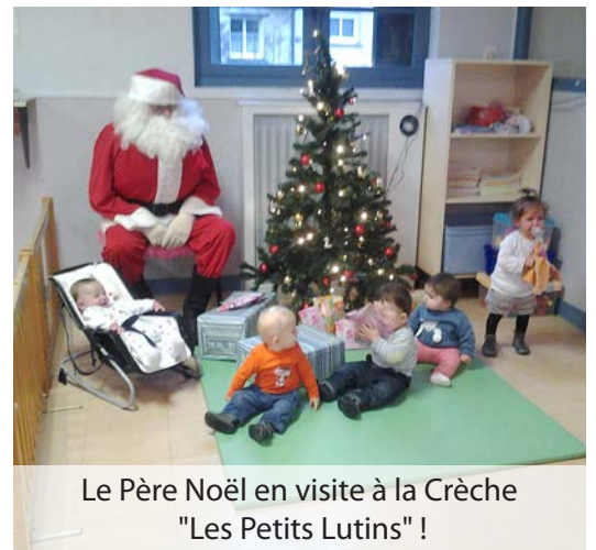
Le Père Noël en visite à la Crèche "Les Petits Lutins" !