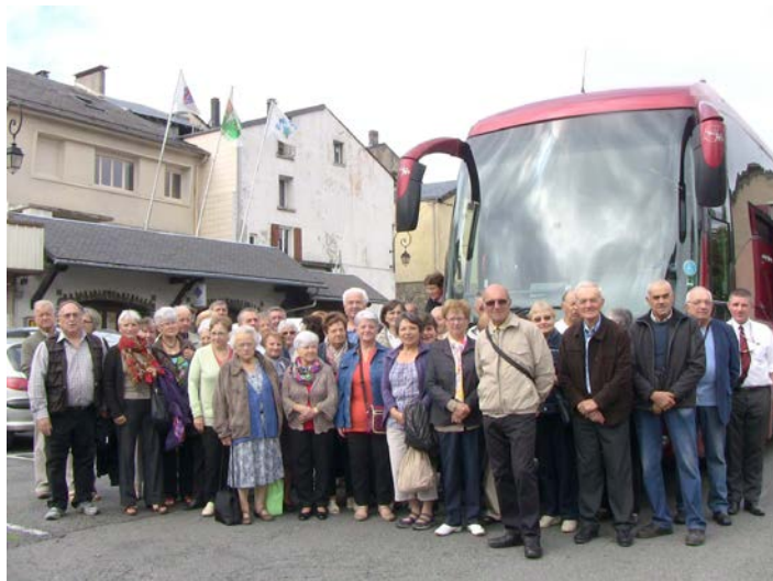
Voyage des Seniors en Vacances. Cette année cap sur St Tropez et sa région. Bonne ambiance durant tout le séjour !

De plus, un document d'information communal synthétique sur les risques majeurs va être distribué à la population. Il reprend les consignes de sécurité à suivre selon le risque.