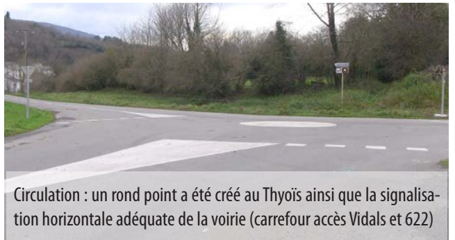
Circulation : un rond point a été créé au Thyois ainsi que la signalisation horizontale adéquate de la voirie (carrefour accès Vidals et 622)