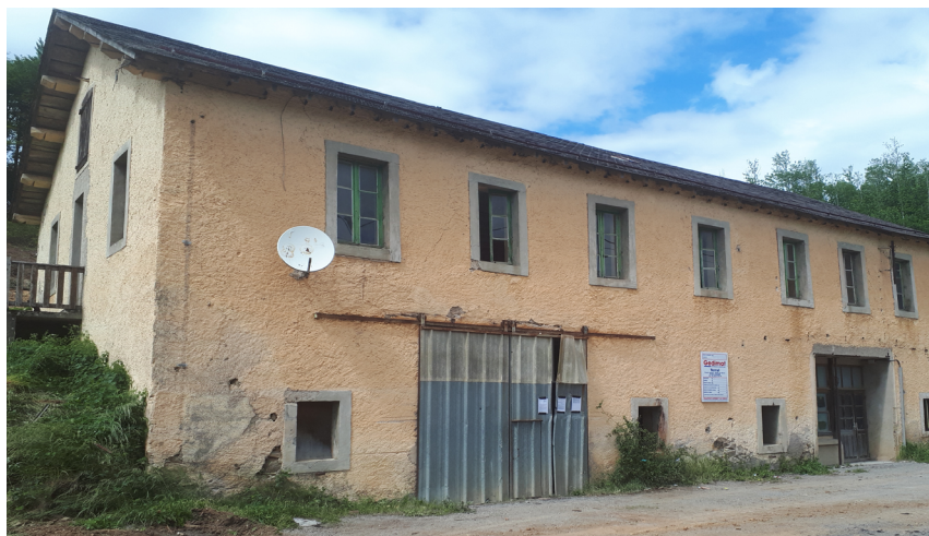
Démolition de l'ancienne MJC pour construction salle intergénérationnelle