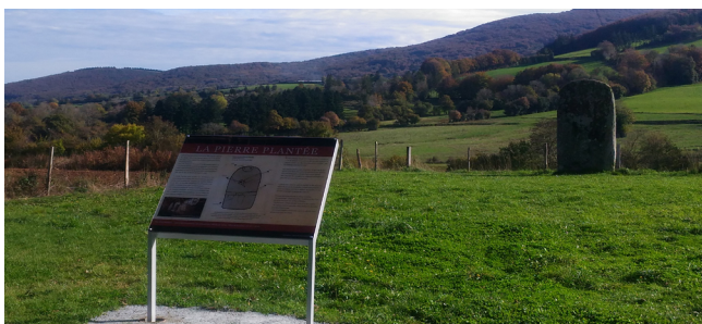
Mise en place d'un panneau explicatif à la Pierre Plantée