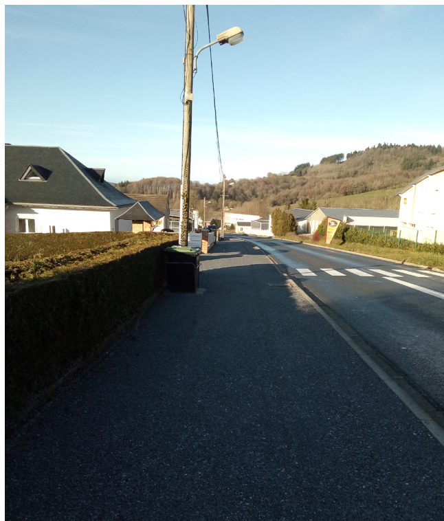
Aménagement et élargissement trottoirs entrée de ville