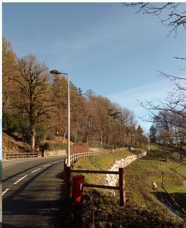
Mise en place de lampadaires