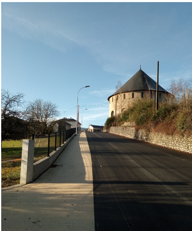
Matérialisation de la voie douce