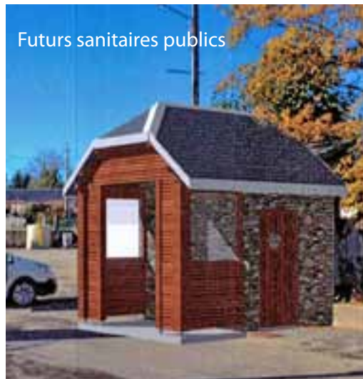
Futurs sanitaires publics