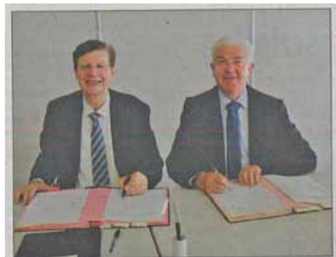
Thierry Carcenac, président du Département et Robert Bousquet, président de la communauté de communes des Monts de Lacaune et de la Montagne du Haut-Languedoc, ont signé la convention.

La Communauté de Communes devra participer à hauteur de 50 % pour le réseau de distribution. Ce réseau est également financé par l'Etat, la Région et l'Europe.