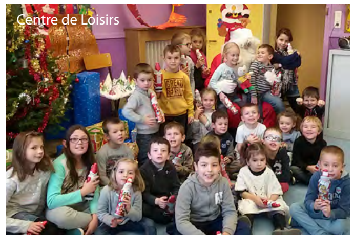
Centre de Loisirs