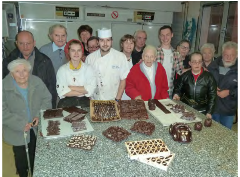
Le Maître et ses élèves devant leurs réalisations !

En repartant (un peu tristement) nous avons réalisé qu'après Noël ... il y aura Pâques !