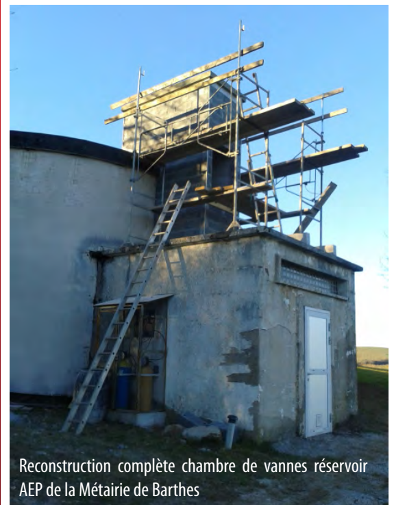
Reconstruction complète chambre de vannes réservoir AEP de la Métairie de Barthes