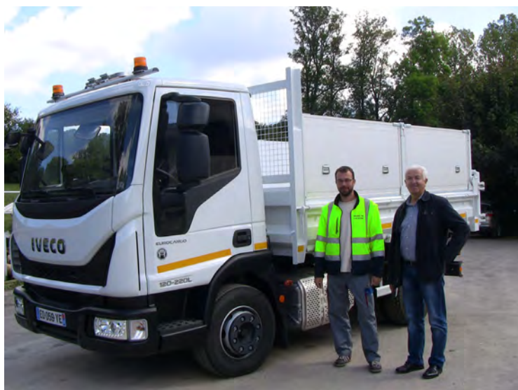
Renouvellement d'un camion IVECO avec option saleuse.